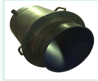
フッ素樹脂コーティング

フッ素樹脂の優れた耐食性は、周知のごとくですが、耐浸透・透過など、より拘った耐食性を追求しております。