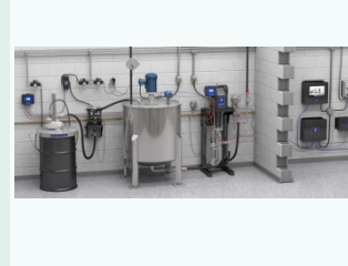
統合型ペイントキッチン

塗料循環室の圧送ポンプのパラメーター・攪拌機の回転数・補給ポンプの動作・タンクの液面管理・液圧や背圧の管理などシステムの稼働と設備保全に寄与。