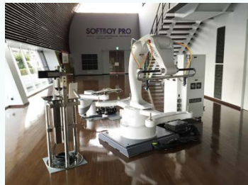
塗装ロボット スワン

防爆自立型ロボットと高精度Wターンを合体させた、回転塗装Rの技術専用塗装ロボットで、必要な機器を全て装備。オート化にも対応。