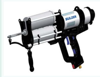
2成分混合吐出システム

取扱いの煩雑な2成分接着剤・塗料等を、1成分同様に扱う。1:1～25:1まで様々な混合体積比に対応可能。