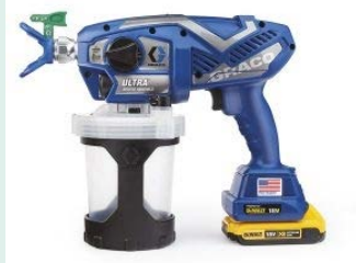
ウルトラMAXコードレス