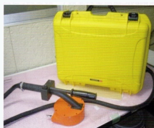
IH塗膜剥離機「メクレル」

IHでワークに過電流を発生加熱。冷めると塗膜との間で層間剥離が起こり、スクレーパーで簡単に塗装を剥離可能。