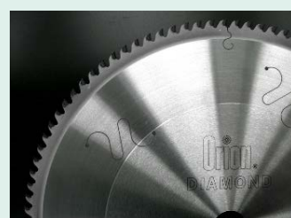
CFRP高速切断用 ダイヤモンドチップソー