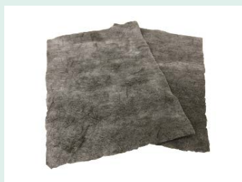
炭素繊維不織布 疾風-HAYATE-