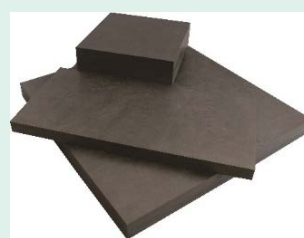
高精度・精密加工対応 CFRPプレート