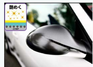
【艶めく】CFRP素材への コーティング