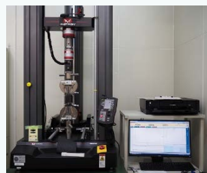
複合材料の物性測定